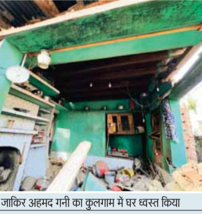
आतंकी जाकिर अहमद गनी का कुलगाम में घर ध्वस्त किया